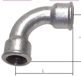
lang Typ 2/G1 kurz Typ 2a/D1